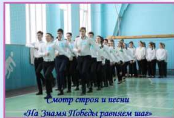
Смотр строя и песни «На Знамя Победы равняем шаг»